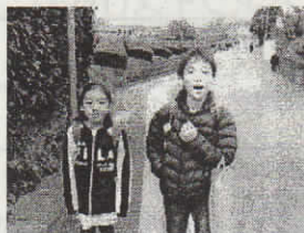
【あ】 かるく あいさつする子